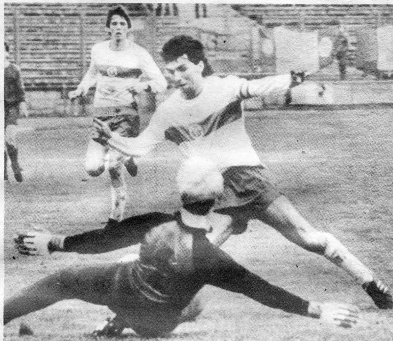
Ein Tor für den FC Hansa bahnt sich an. Schlünz umkurvt Babelsbergs Torhüter Herber. Sekunden später hält Petsch das Leder mit der Hand auf. Strafstoß!

Ludwigsfelde bislang vor. Gefühle und Stimmungen schwankten zwischen Hoch (Siege gegen Chemie Leipzig, Prenzlau, FC Hansa/3:2!) und Tief (Niederlagen gegen Babelsberg, ISG, Rotation, Dessau/0:6!). Beim Neuling fast typisch: Nach Punktgewinnen folgten Enttäuschungen. Trainer Ulli Strumpf zur Situation: „Es fehlt an Stabilität. Mit weiteren Ansprüchen und Anforderungen werden wir künftig den Entwicklungsprozeß besser meistern. Am Willen, an Talent und Erfahrung mangelt es nicht. Größere Homogenität aller Mannschaftsteile, Härteverträglichkeit, taktisch klügeres Umkehrspiel und bessere Schußleistungen sind nötig. Nur so ist das Ziel Klassenerhalt möglich.“ f. k.