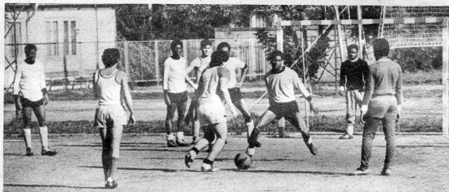
Szene aus der Begegnung Mozambique gegen Kuba in der Vorrunde.